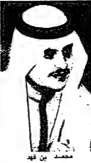
محمد بن فهد

عكاظ - الدمام : لكر معالي الاستاذ علي بن حسن الشاعر وزير الاعلام على ان فكرة جائزة سمو الامير محمد بن فهد بن عبدالعزيز للتفوق العلمي قد حلت نجاحا كبيرا ومتيناً. جاء ذلك في برقية من معاليه تلقاها صاحب السمو الملكي الامير محمد بن فهد بن عبدالعزيز في الساعة الثامنة من مساء يوم الثلاثاء الموافق ١٨ شوال حفل تكريم المعلم وإدارة التعليم بالمنطقة الشرقية كما يستقبل في ظهر اليوم نفسه بكتبة سموه بصرى الامارة بالدمام السفير القروي لدى المملكة كما سيقيم سموه بعد ظهر السبت ١٥ شوال ١٤٠٤ هـ باستقبال السفير القروي لدى المملكة السيد بيكاه وريلا ثم يتفضل سموه بعد ظهر الأحد ١٦ شوال بزيارة تفقدية لفر الادارة العامة لشعبة المنطقة الشرقية بالدمام كما يستقبل في اليوم الذي يليه السفير الهندي لدى المملكة.